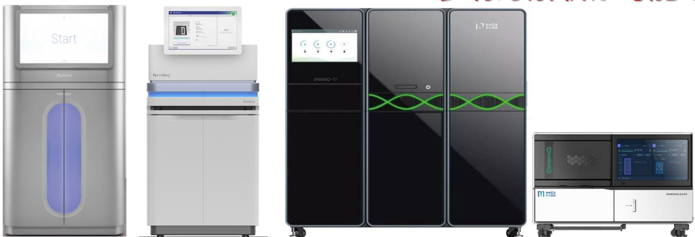
NovaSeq X Plus