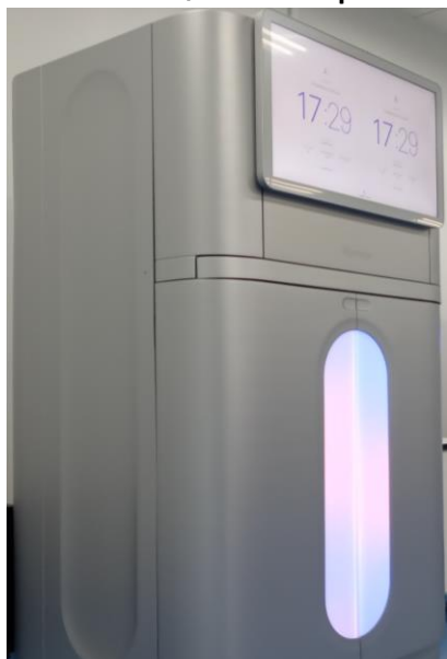
イルミナ社 NovaSeq X Plus