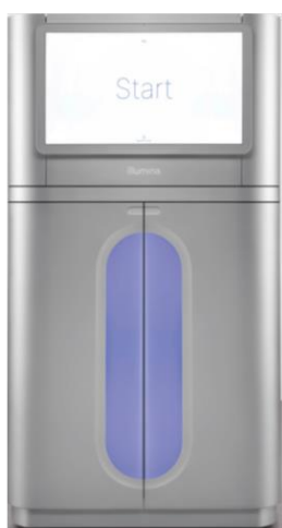
NovaSeq X Plus